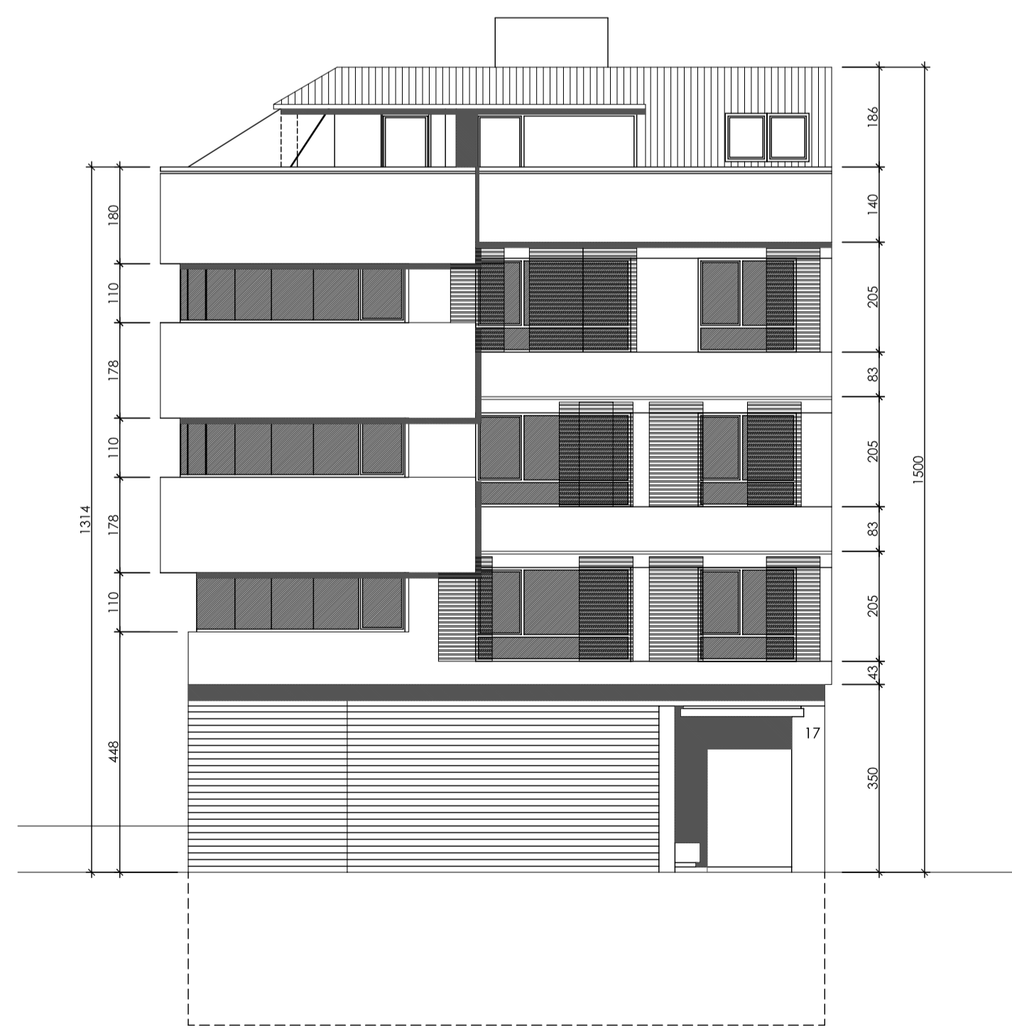
alzado frontal (c/ camiño novo)